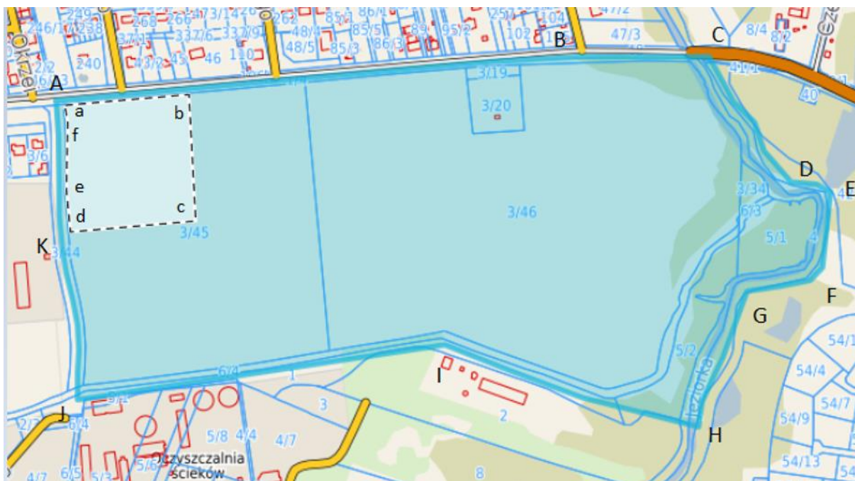
Rysunek nr 2 - Schemat lokalizacji granic opracowania.