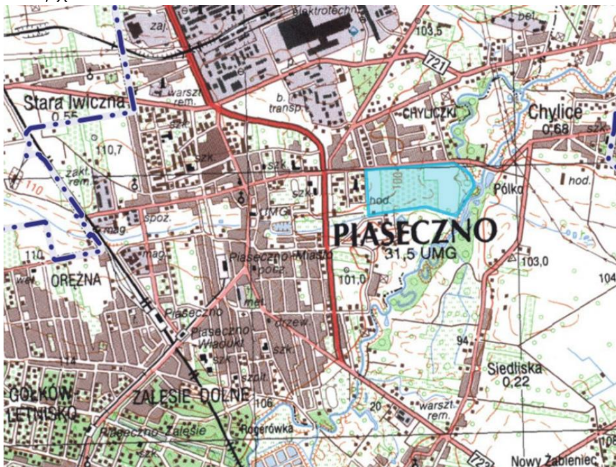
Rysunek nr 1 – Lokalizacja.

Obszar opracowania znajduje się we wschodniej części miasta przy jednej z ważniejszych ulic miejskich – ul. Chyliczkowskiej. Drugą ulicą sąsiadującą bezpośrednio z działką 3/45 od strony zachodniej jest, dziś niewiele znacząca, ul. Mazurska (działka drogowa nr 3/44). Docelowo ul. Mazurska ma połączyć się z ulicą Żeromskiego tworząc ważny ciąg komunikacyjny dla południowej części miasta. Projektowana droga wraz z infrastrukturą techniczną ułatwi obsługę terenu przeznaczonego pod inwestycję.